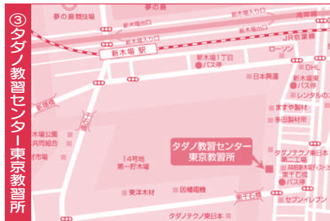
〒136-0082 江東区新木場1丁目13-5